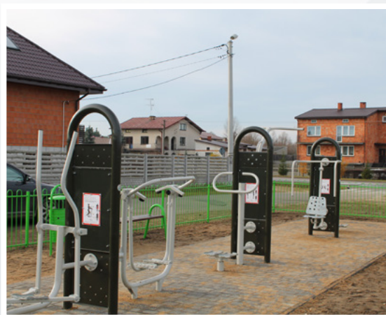
Siłownia napowietrzna w Odrzywole