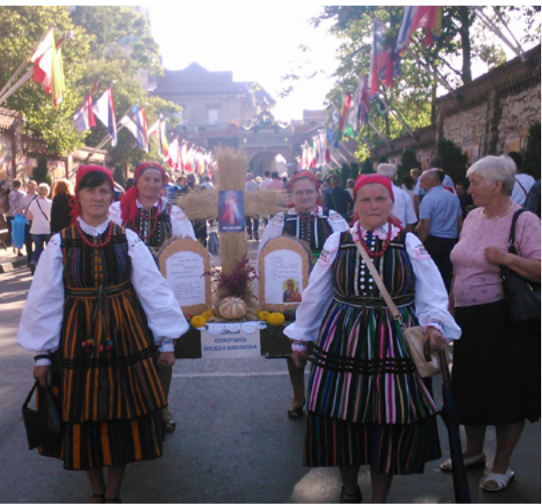
Dożynki Rolników w Częstochowie 2015