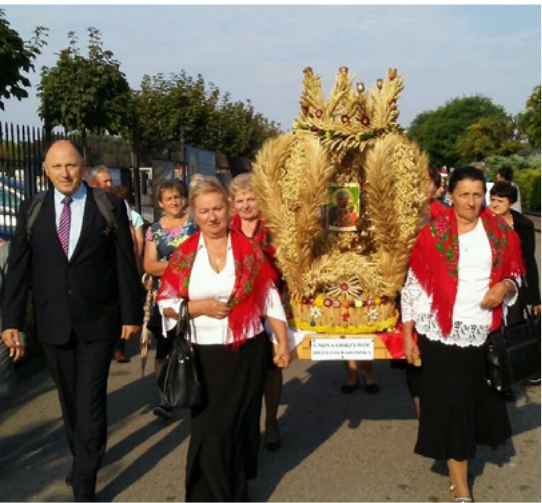
Dożynki Rolników w Częstochowie 2018