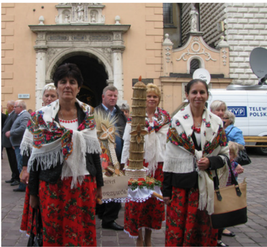
Dożynki Rolników w Częstochowie 2016