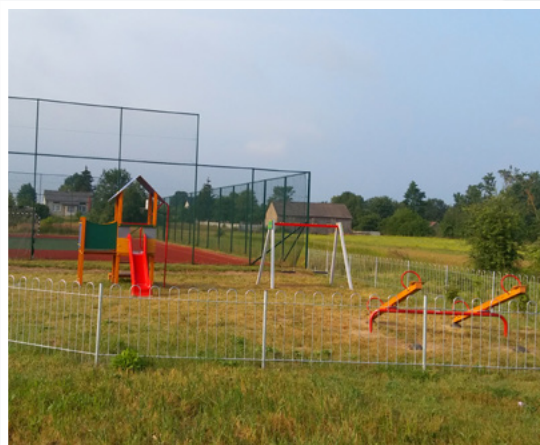
Plac zabaw w Kłonnie