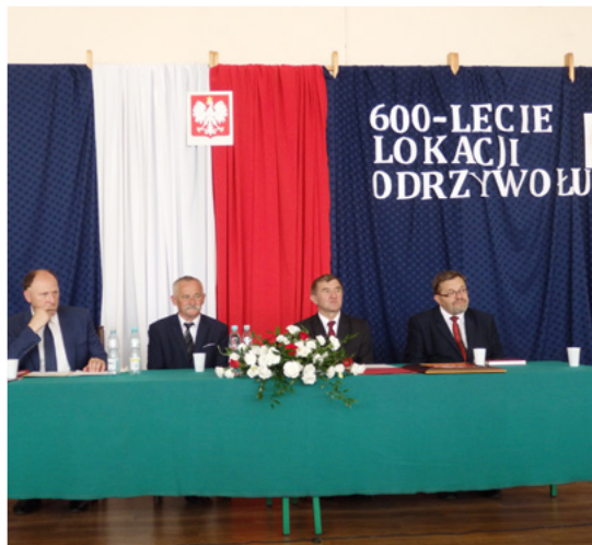
600-lecie lokacji Odrzywołu