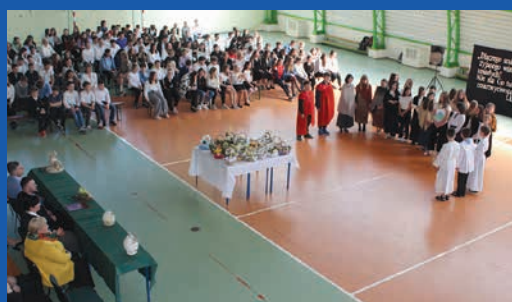
Apel wielkanocny w Wieniawie. Więcej s.28