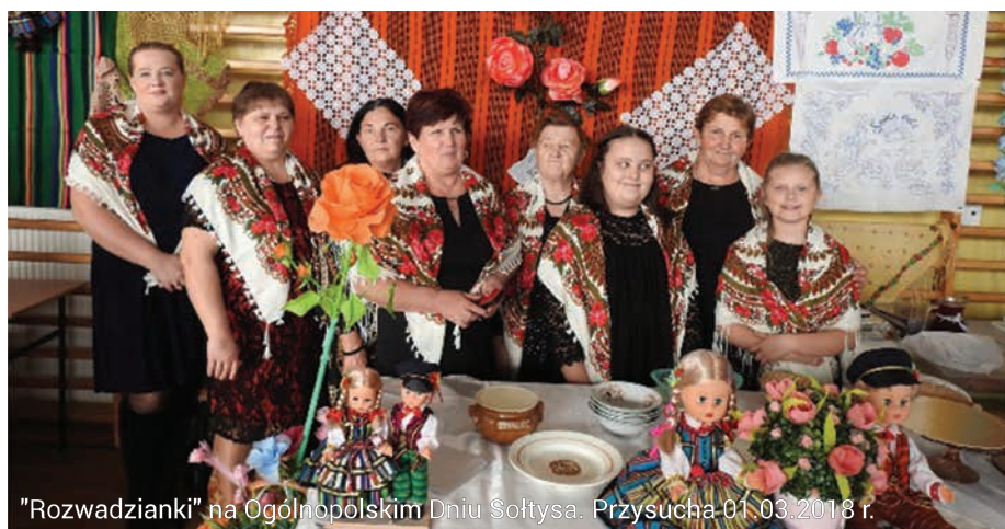
„Rozwadzinki” na Ogólnopolskim Dniu Sołtysa. Przysucha 01.03.2018 r.

reprezentując gminę Gielniów z wieńcem dożynkowym oraz regionalnymi potrawami. Stowarzyszenie uczestniczy w Festiwalu Folklorystycznym w Odrzywole. 11 marca 2018r. Rozwadzinki biorą udział w Dniu Sołtysa w Przysusze. Organizują Święto Ochotniczej Straży Pożarnej Gminy Gielniów, imprezy integracyjne dla mieszkańców sołectwa Rozwady i gminy Gielniów „Święto Pieczonego Ziemniaka”. Dzięki środkom pozyskanym przez Stowarzyszenie w ramach współpracy z Lokalną Grupą Działania „Wszyscy Razem” w 2017 roku powstała w miejscowości Rozwady siłownia pod kasztanem. Wartość projektu 25.000,00zł. W ramach pozyskanych środków z Ofert Realizacji Zadania Publicznego udało się doposażyć Świetlicę Wiejską w Rozwadach w niezbędny do jej funkcjonowania sprzęt. Ciągła chęć rozwoju członków oraz dążenia do zamierzonych celów sprzyja rozwojowi stowarzyszenia.