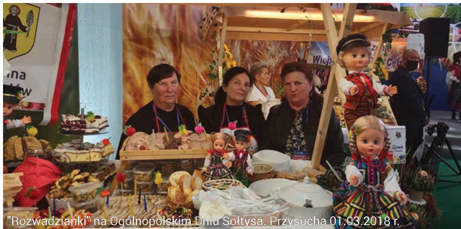
„Rozwadzinki” na Ogólnopolskim Dniu Sołtysa. Przysucha 01.03.2018 r.

cji, osób starszych, chorych i samotnych, promocja i organizacja wolontariatu. Stowarzyszenie „Rozwadzinki” corocznie uczestniczy w dożynkach powiatowych