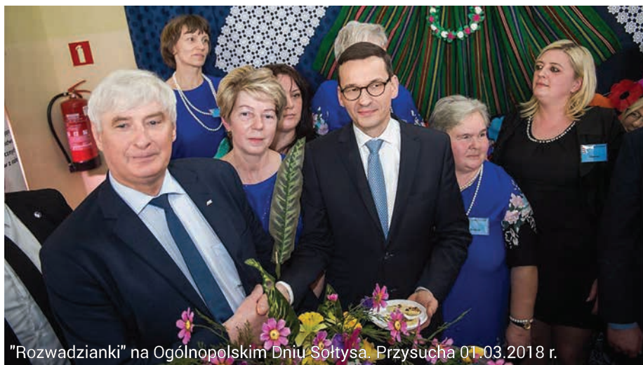
„Rozwadzinki” na Ogólnopolskim Dniu Sołtysa. Przysucha 01.03.2018 r.

Stowarzyszenie „Rozwadzinki” powstało w listopadzie 2011 z inicjatywy mieszkańców wsi Rozwady. Główną przyczyną, jaka wpłynęła na decyzję o powstaniu stowarzyszenia była chęć zintegrowania mieszkańców wsi oraz poprawa warunków bytowych jej mieszkańców i wypromowanie terenu naszej wsi. Przy wykorzystaniu wsparcia oferowanego w ramach projektu „RAZEM – inicjatywy z obszaru ekonomii społecznej”, realizowanego przez Europejski Dom Spotkań – Fundację Nowy Staw ze środków Unii Europejskiej, w ramach Europejskiego Funduszu Społecznego, podejmowane były działania zmierzające do zawiązania Stowarzyszenia. 15 marca 2012 roku Stowarzyszenie „Rozwadzinki” zostaje zarejestrowane w Krajowym Rejestrze Sądowym. Stowarzyszenie „Rozwadzinki” ma swoją siedzibę w Świetlicy