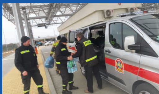
Pomoc dla Ukrainy z Rusinowa. Więcej s. 26