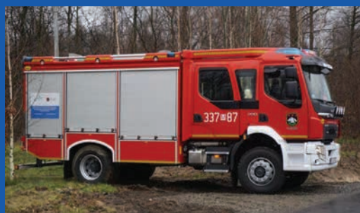
Nowe wozy gaśnicze w gminie Potworów. Więcej s. 19